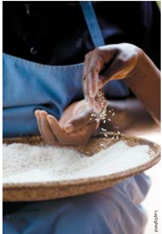
I Mbabane i Swaziland skal SOS-mor Sitakele betale 38 USD for en sæk ris, som sidste år kostede 25 USD.

SOS-Børnebyerne internationalt er på grund af krisen blevet nødt til at øge budgetterne; i alt er mer-omkostningen 35 mio. kr. i 2008. I 2009 bliver den efter al sandsynlighed endnu større.