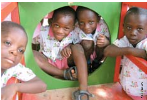
Sidste år blev SOS-Børnebyerne i Ghana udvalgt som årets NGO (nongovernmental organisation) i landet.

I Europa har SOS-Børnebyerne sammen med to andre organisationer stået bag udarbejdelsen af kvalitetsstandarder for børn, som ikke kan bo hos deres forældre. Og på internationalt plan deltog SOS-Børnebyerne i udarbejdelsen af FN's retningslinjer for forældreløse og forladte børn ("Guidelines on the