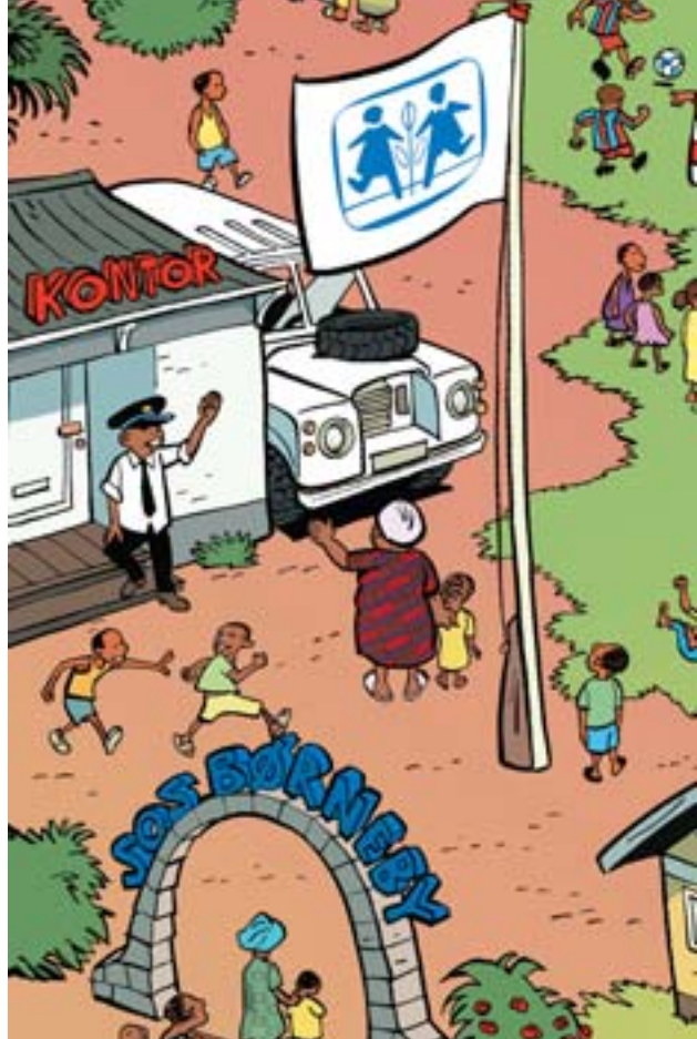
Led efter SOS-moderen og de legende børn i SOS-versionen af tegneserien "Find Holger".