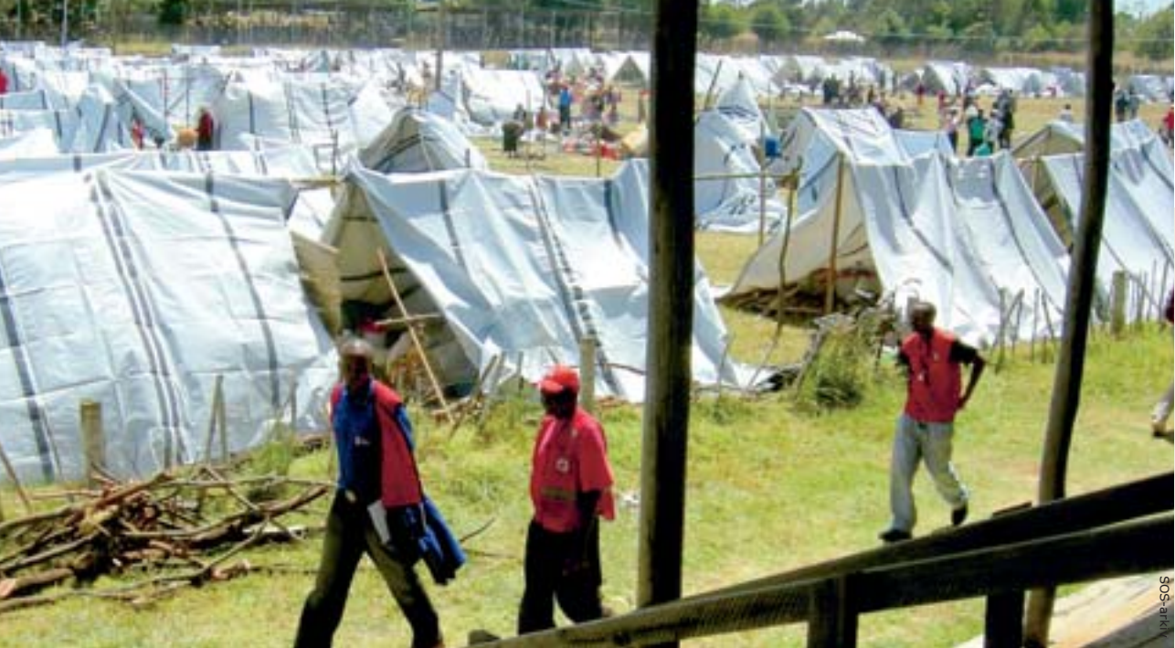
SOS-Børnebyerne hjælper i nogle af de hastigt opslåede teltlejre omkring de store byer i Kenya.