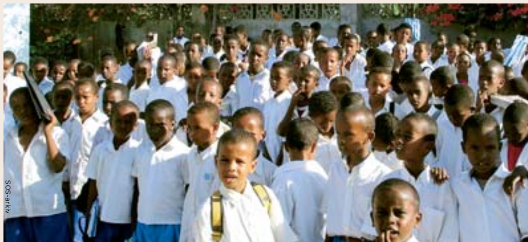
Sådan var skolelivet for børnene i SOS-børnebyen i Mogadishu før evakueringen.