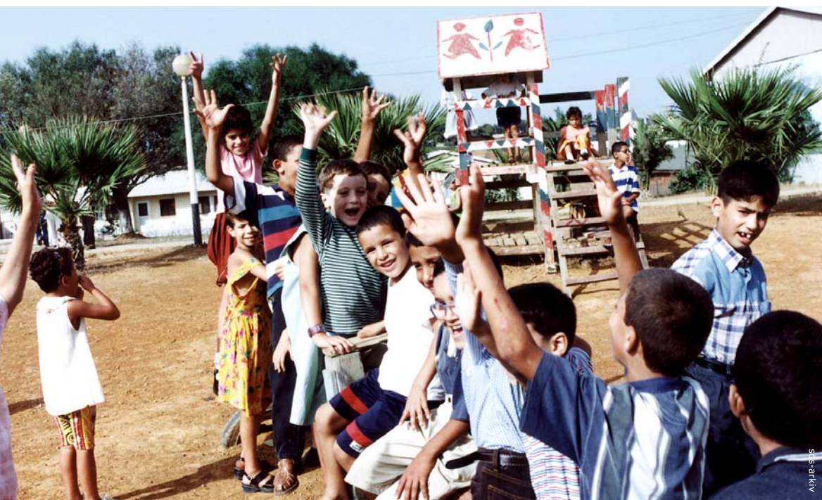
Børnene bliver undervist både alene og i grupper flere gange om ugen.