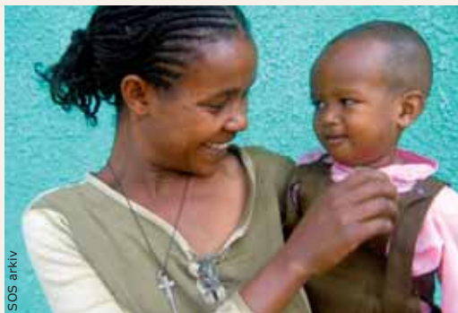
Tusindvis af kvinder i Etiopien vil få gavn af pengene fra Danmarks Indsamling 2010, når SOS-Børnebyerne åbner et nyt socialcenter i Jimma.

Du vil komme til at kunne læse meget mere om Jimma og Danmarks Indsamling 2010 på vores hjemmeside www.sos-borneby.dk