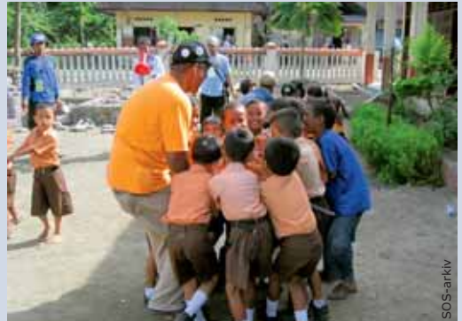
Gennem bl.a. leg forsøger SOS-Børnebyerne at hjælpe børnene med at bearbejde deres traumer.

Der er tale om en bred indsats, der går lige fra at skabe frirum til at lege og bearbejde