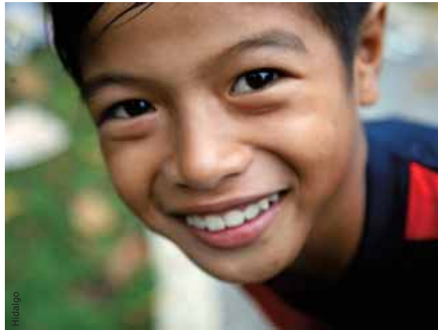
Som fadder har du mulighed for at hjælpe et konkret menneske, der har brug for din hjælp.