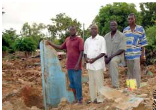
Tusindvis af mennesker mistede alt under de voldsomme oversvømmelser i Vestafrika.

til de hårdest ramte beboere i området omkring børnebyen i hovedstaden Ouagadougou. Mange danskere bakkede op omkring SOS-Børnebyernes arbejde efter oversvømmelserne, ved at gå ind på nettet og donere penge til vores arbejde i Burkina Faso.